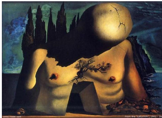
Labetinto, Salvador Dali, 1941.

Esta obra de Dalí llamada “Laberinto”, es sugerente para incitar a la vida a hacer un tránsito hacia nuestros adentros, hacia ese universo infinitamente pequeño de nuestros propios laberintos; tomando el riesgo de salir a enfrentar lo desconocido, siendo la emoción la que